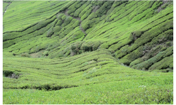
▲馬來西亞金馬崙高原的寶樂茶 (Boh Tea) 茶園生產地景

們無法持續下去。例如農村人口老化，廢耕比例越來越高，使得植被改變，生物多樣性下降；農業政策鼓勵種植大面積的單一作物，直接衝擊生物多樣性和小農的經濟收入；傳統知識的流失、傳統社會體系的弱化，也都不利於維持一個生態的生產地景。