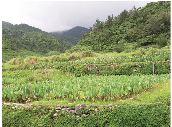
▲蘭嶼以生產芋頭為主的農業地景