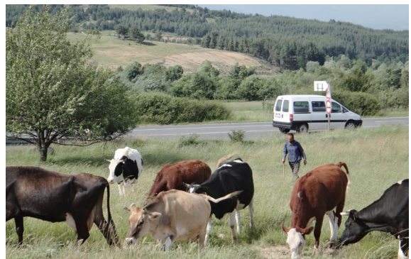
▲ 生物多樣性公約保障、鼓勵符合保育和永續使用的傳統生物資源利用方式。

這個公約的草擬是由聯合國環境規劃署（United Nations Environment Programme, UNEP）協調的，聯合國環境規劃署的任務在於保護環境，而非開發、利用。在這樣的組織安排下，公約的調性自然免不了以保護而非實際利用為主。然而開發中國家持不同的意見，它們認為生物多樣性不應該只保護不利用，經過冗長的談判、折衝，最後終於決議將「保育生物多樣性」與「永續使用生物多樣性」分別列為《生物多樣性公約》的第一和第二項目標。