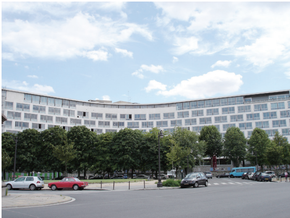
▲舉行「里山倡議全球研討會」聯合國教科文組織

(X/32) 共計 9 條，其中只有第 5-9 條和「里山倡議」有關。締約方大會首先肯定「里山倡議」是永續使用生物多樣性的一個有用的工具（第 6 條），其次鼓勵各方進一步討論、分析及瞭解「里山倡議」（第 7 條），並參與「里山倡議國際夥伴關係」（第 8-9 條）。從決議本身看不到「里山倡議」的詳盡說明，有關於「里山倡議」的背景、整體目標、特定目的與活動、支援倡議的機制等，還是要參考 2010 年在聯合國教科文組織舉行「里山倡議全球研討會（Global Workshop on the Satoyama Initiative）」後所提出「有關『里山倡議』的巴黎宣言」（Paris Declaration on the “Satoyama Initiative”）（ http://www.cbd.int/doc/meetings/sbstta-14/information/sbstta-14-inf-28-en.doc ）才能清楚。