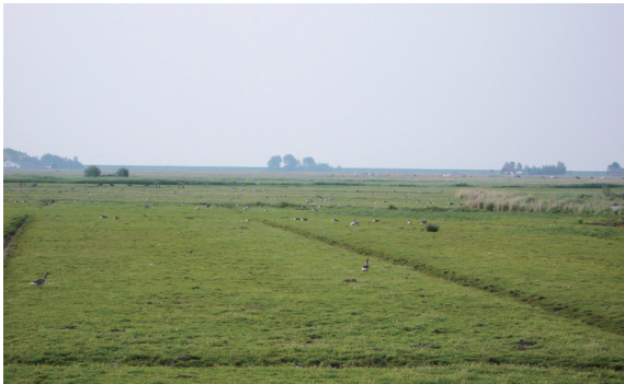
▲荷蘭的農牧生產地景也為野生鳥類提供棲地

社會和環境的需求，實則是永續的生產系統（Sustainable Production Systems）。